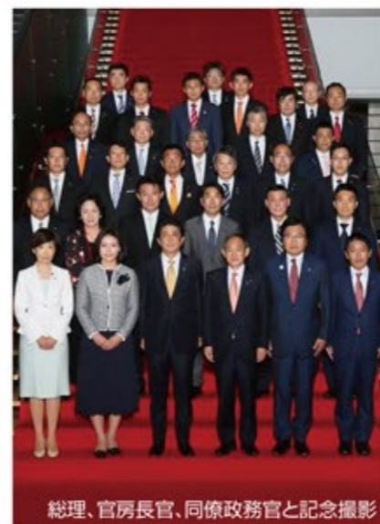
総理、官房長官、同僚政務官と記念撮影

8月より内閣府大臣政務官兼復興大臣政務官*に就任しました。内閣府では、防災・国土強靱化、地方創生、食品安全・消費者行政、行政改革、海洋政策といった幅広い事項を担当し、復興庁では、東日本大震災復興の岩手県担当等にあたっています。