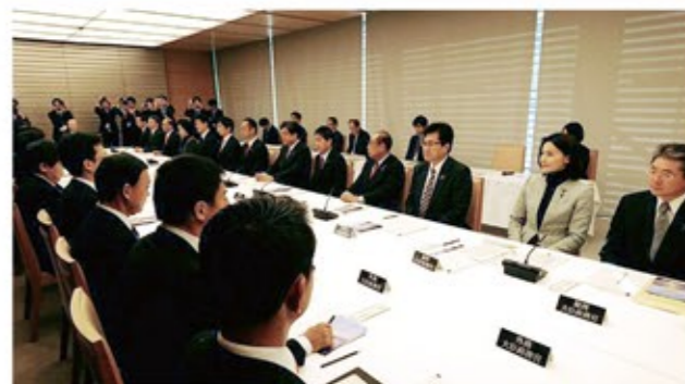
▲月例政務官会議に出席

8月より内閣府大臣政務官兼復興大臣政務官*に就任しました。内閣府では、防災・国土強靱化、地方創生、食品安全・消費者行政、行政改革、海洋政策といった幅広い事項を担当し、復興庁では、東日本大震災復興の岩手県担当等にあたっています。